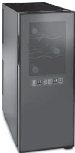
TỦ RƯỢU - VT12 BIZONE